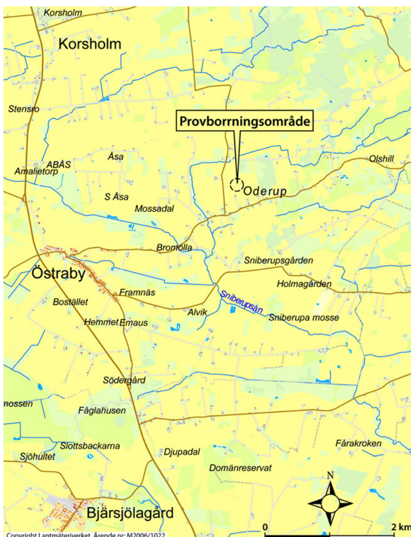
Figur 2. Översiktskarta. Ärende nr 2006/M0 M2006/1022

Anmälan enligt 21 § Förordning (1998:899) om miljöfarlig verksamhet och hälsoskydd krävs för djupborrningar enligt verksamhetskod 13.70, C, i bilagan till förordningen. Till anmälan ska en miljökonsekvensbeskrivning i erforderlig omfattning göras. Syftet med föreliggande anmälan är således att belysa var provborrningen ska utföras, hur den ska genomföras samt vilken miljöpåverkan detta kan komma att medföra. Skyddsåtgärder och försiktighetsmått beskrivs också i anmälan. Anmälan lämnas till kommunen som har att ta ställning till om verksamheten kan medges.