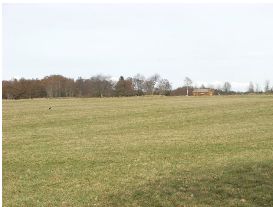
Figur 3. Foto över arbetsområdet med omgivelser.

Omgivningarna består i huvudsak av öppen jordbruksmark, betesmarker med inslag av dungar med lövträd och stengärdsgårdar. Marken utgörs av åkermark, se figur 3. Närmsta bostadshus ligger drygt 200 m från aktuell borrhälsplats och det tillhör markägarens bror. Till det näst närmaste huset är det ca 250 m. Arbetsområdet kommer att nås från väg 1062 via en temporär väg som kommer att anläggas över åkern, bilaga 12.